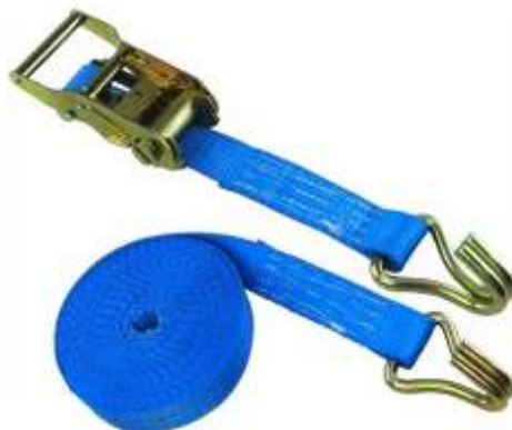
GANCHO J “fechado”